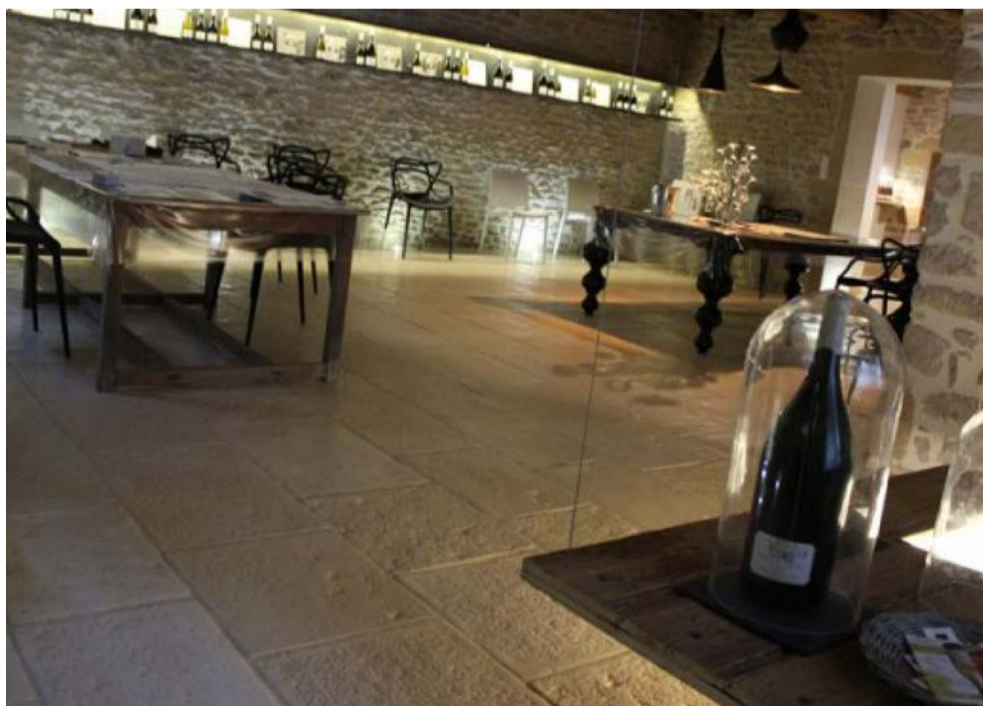
In alto a destra: la proprietà della Famiglia Thibert con la sede, gli uffici e la sala di degustazione. In centro a sinistra: i moderni impianti di vinificazione nella nuova cantina. In centro a destra: l'area di stoccaggio. In basso a sinistra: la sala di degustazione.