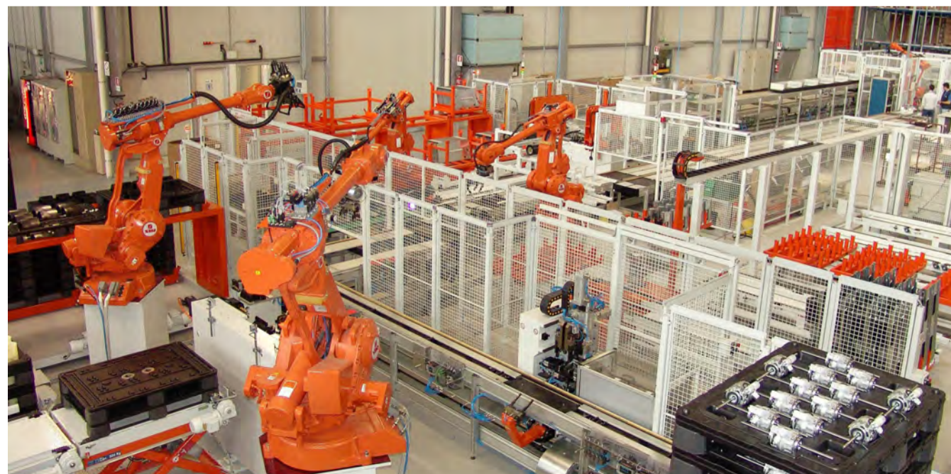
2004 - Per rispondere alle richieste di un mercato globalizzato che richiede grandi numeri, Giordano Riello decide di attrezzare una fabbrica completamente robotizzata, dalle caratteristiche brevettate e che risponde anche alle esigenze della produzione snella.