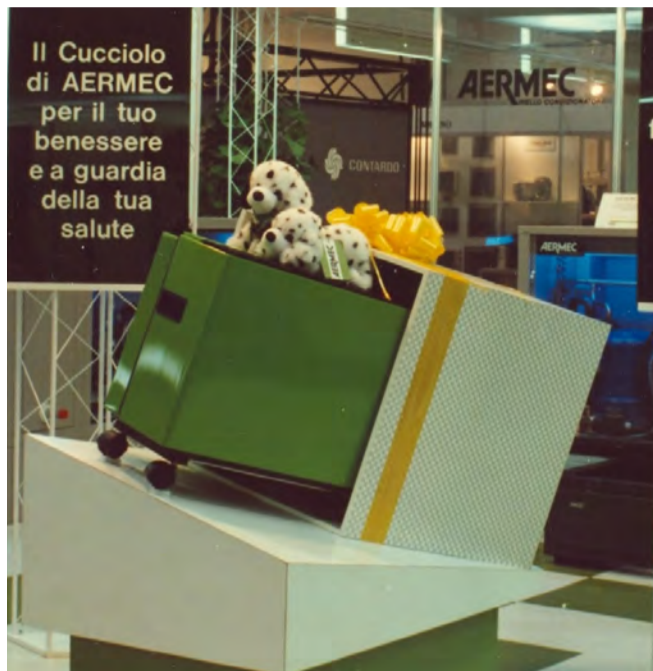
Tre storici modelli che hanno imposto i prodotti Aermec in Italia e in Europa. Il condizionatore da finestra, sul modello di quelli americani; il fan-coil che diventerà il core business di Aermec che ancora oggi mantiene il primato europeo di produzione: il Cucciolo, rivoluzionario condizionatore portatile che adotta la tecnica dello split-system