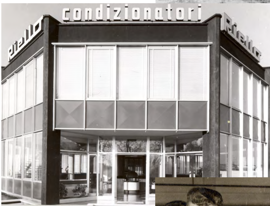
L'Ottagono, disegnato dal famoso architetto milanese Tito Varisco, è ancora oggi l'emblema della fabbrica Aermec.