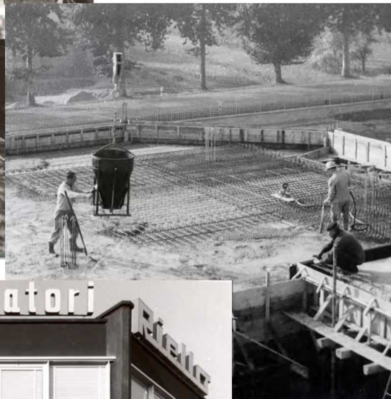
Sotto: la gettata di cemento per l'Ottagono, sede della direzione e degli uffici.