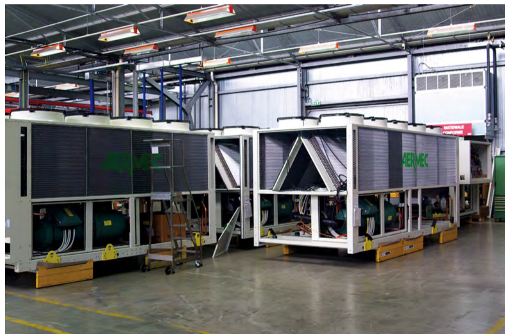
Il mercato si evolve e cresce la domanda di grandi macchine da impianto. Aermec fa un altro salto di qualità e propone alla clientela internazionale una fortunata e apprezzata gamma di prodotti di grande potenza.