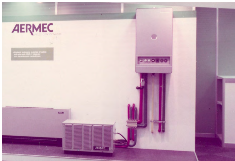
1984 - L'Idrosplit, qui sopra esposto alla Fiera di Milano, è l'innovativa unità a pompa di calore acqua - acqua da collegare a una rete di ventilconvettori. È un'altra delle innovazioni di Aermec.