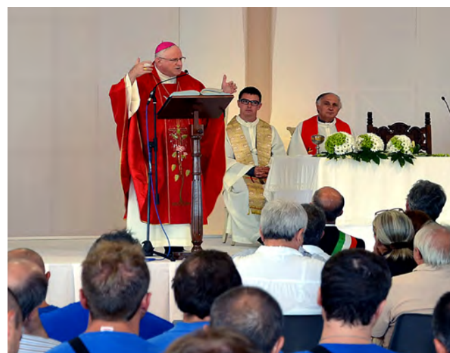
14 settembre 2011 – Le maestranze della fabbrica di Bevilacqua festeggiano i cinquant'anni di Aermec in una elegante tensostruttura appositamente allestita anche per ospitare la celebrazione della S.Messa da parte del Vescovo di Verona, S.E. Mons Giuseppe Zenti. Dopo la commovente cerimonia tutti a brindare nel nuovo capannone dei prodotti finiti.